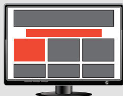
Cuadrado (250 x 200 px) Leader board (728 x 90 px)